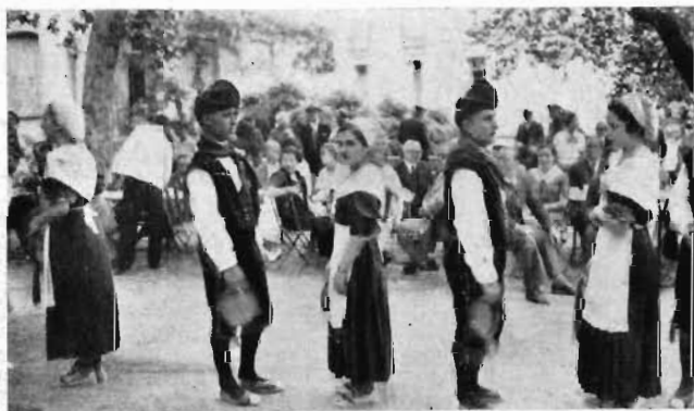
L'esbart de dansaires d'Amèlia es disposa a fer una exhibició de ballets catalans a honor dels congressistes aplegats al pati de les Termes Pujade.

Ara fa dos anys, fou la Societat de Cirurgia de Catalunya l'encarregada d'organitzar la tasca, i certament un èxit magnífic assistí els propòsits dels organitzadors, car no fou pretext per a motivar un d'aquells esplais verbalístics que acostumen a produir-se entorn d'un nom agafat com excusa per a lluíment personal d'uns oradors més o menys dotats, sinó que constituí una bella avinentesa per a suscitar esplèndides aportacions a la bibliografia corresponent a l'obra de l'home i a les essències de la personalitat homenatjada.